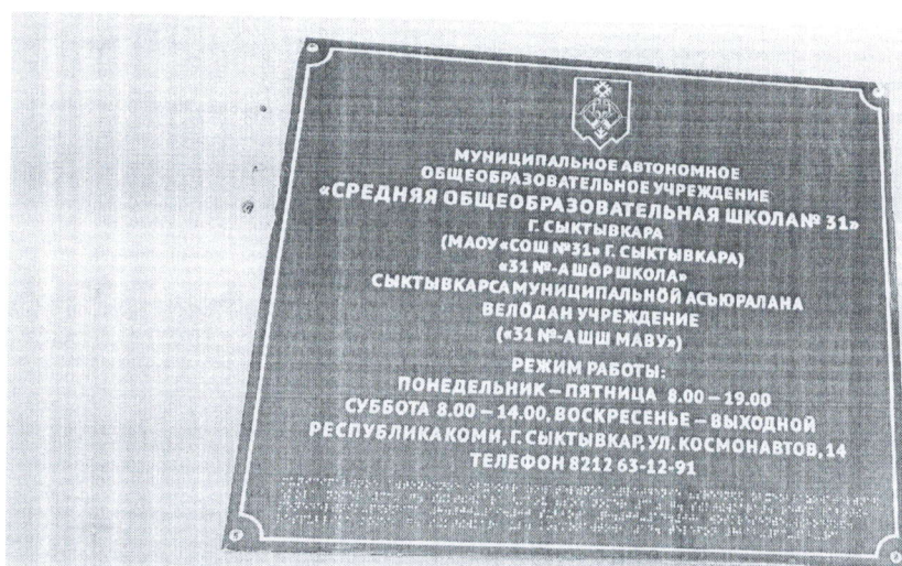
Фото №1. Табличка на входе в здание школы выполненная шрифтом Брайля.

Приложение к акту выполненных работ по адаптации объекта и повышению уровня доступности образования для людей с инвалидностью и маломобильным группам населения (МГН) в период с 2018 по 2022 годы к паспорту доступности ОСИ № 99 от 30.07.2018 года